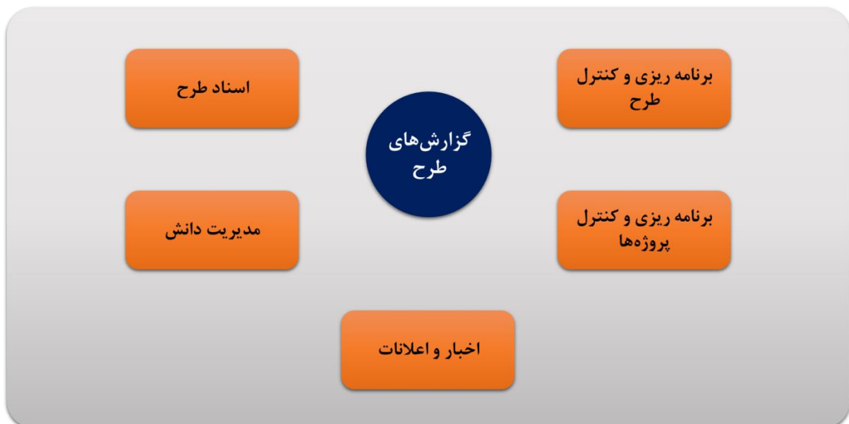
تصویر ۱- اجزای سامانه مکانیزه مدیریت طرح

توضیحات تکمیلی هریک از اجزا در بخش ۳ ارائه شده است.